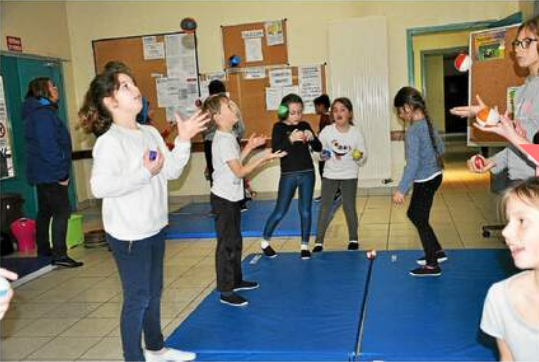
Les élèves de Victor-Hugo en pleine répétition de jonglage.