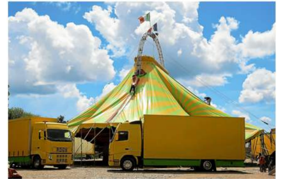
Lundi 10 juin, l'Amicale de l'école Victor-Hugo accueillait les professionnels du cirque franco-italien. À 15 h le chapiteau s'élevait.