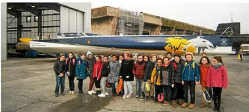
Les élèves de CM1 de l'école Victor-Hugo ont visité la Cité de la voile à Lorient.